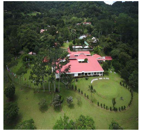
国連平和大学 (University for Peace)

平和学入門、紛争行動理論、軍事化と軍縮、などの平和構築のための基礎知識を学びながら、世界中の学生とグループワークやディスカッションを行い、学びを深めていくプログラムです。その基礎コースに、市大生も参加することができます。今年度は下記の3つの方法での参加が可能となっています。