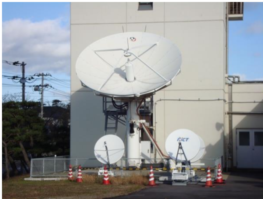
実験に使用した 5m 級アンテナを持つ大型地球局 (中央) (情報通信研究機構 鹿島宇宙技術センターにて撮影)

提案技術である TCP-STAR を Linux OS 内に実装しています。そして、実証実験を JAXA 筑波宇宙センターや情報通信研究機構 鹿島宇宙技術センターなどで実施しています。