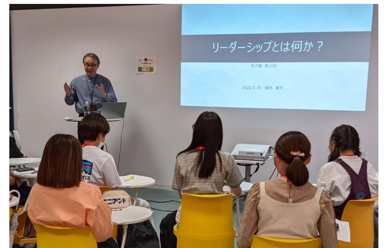
リーダーシップ概論