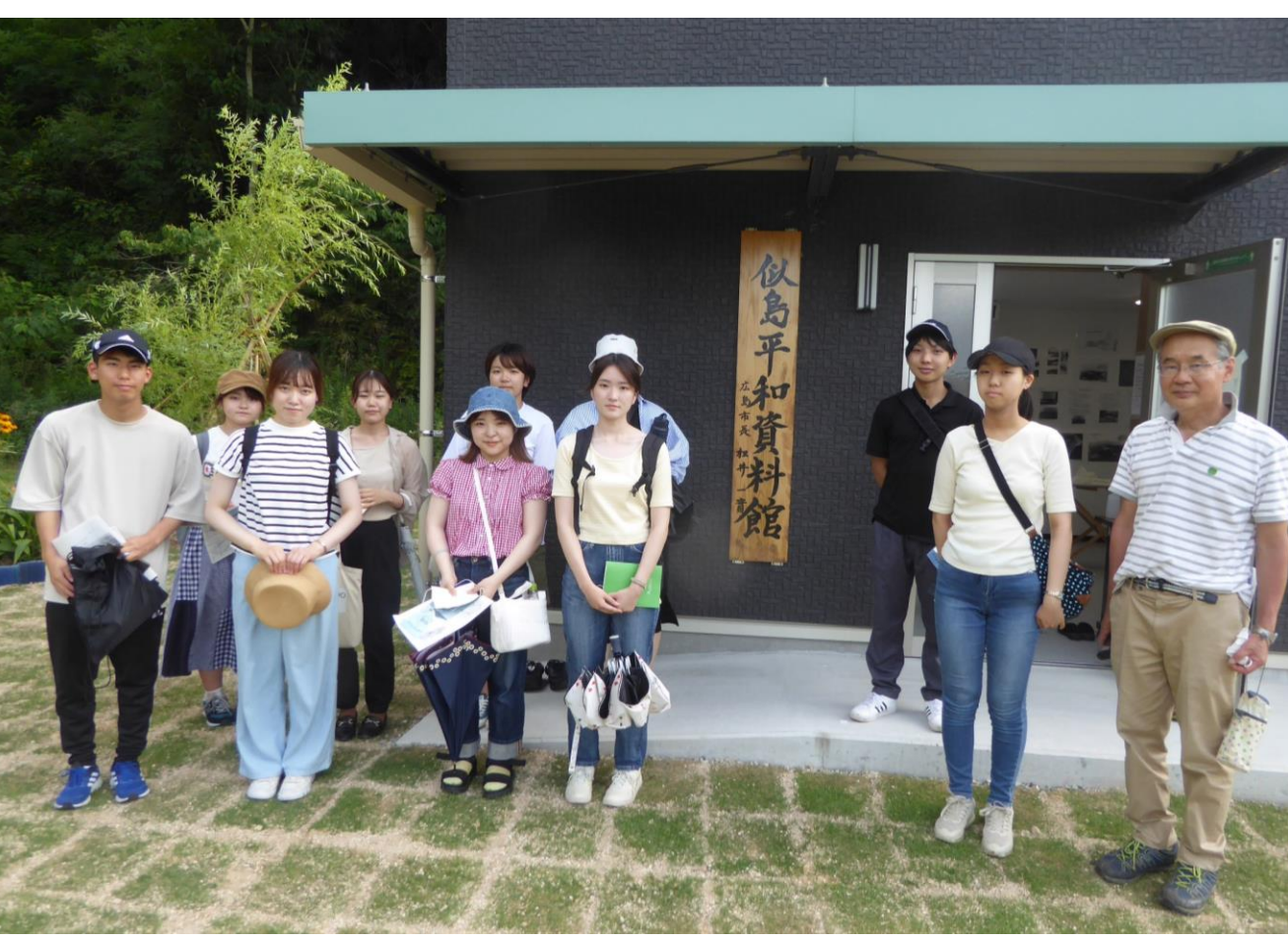
似島の戦跡と平和資料館を訪ねる