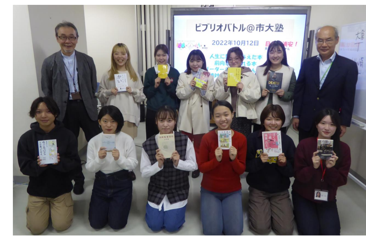
ピブリオバトル@市大塾