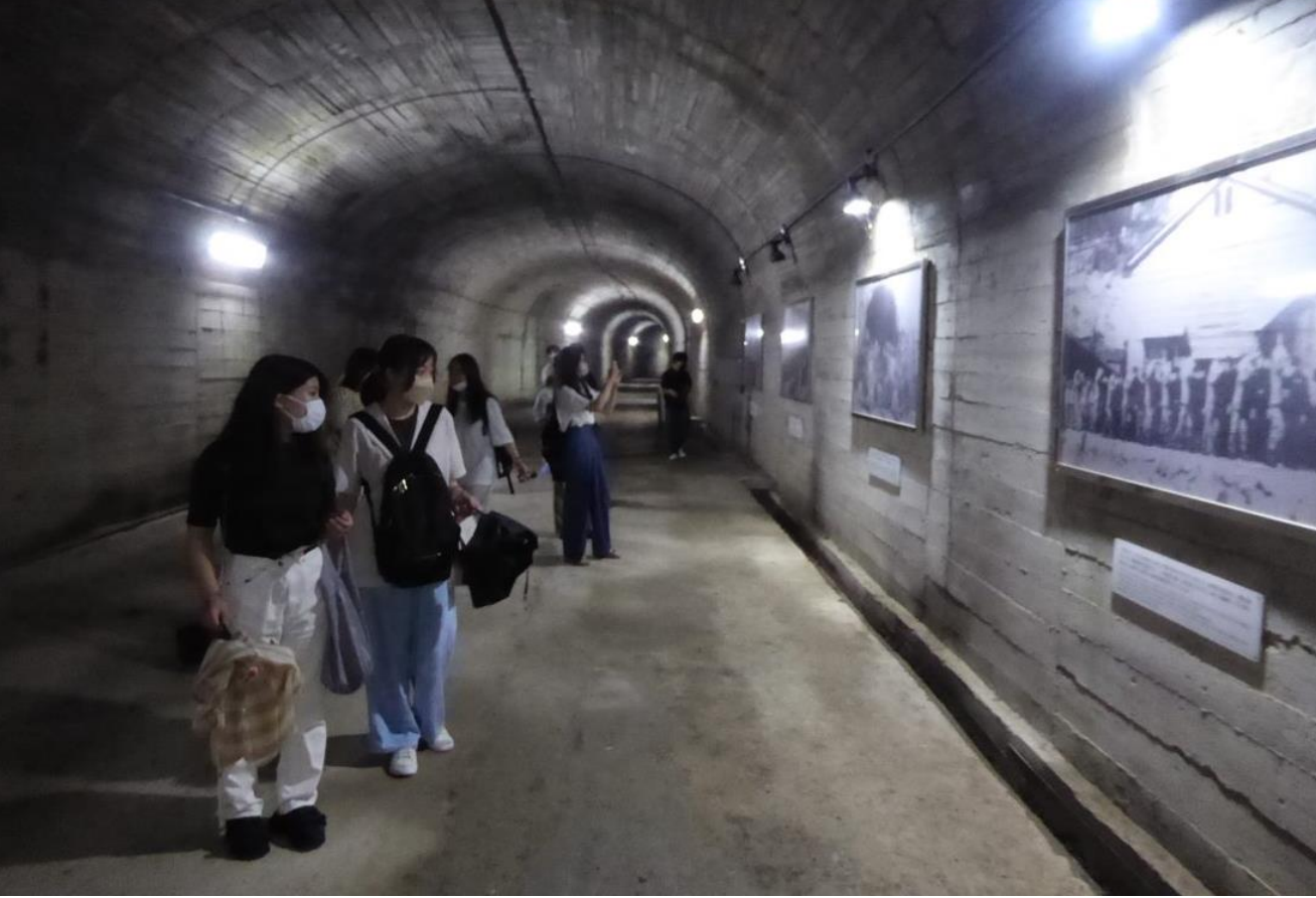
回天記念館と訓練場跡を訪ねる (周南市)